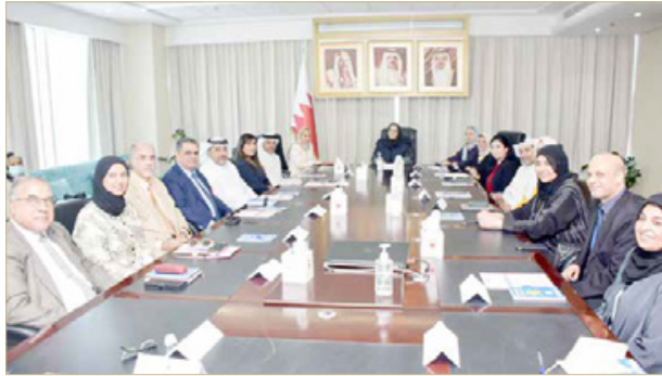
المنامة - وزارة الصحة

أكدت وزيرة الصحة جلييلة السيد، الحرص على المضي قدماً في رسم الخطط والاستراتيجيات الرامية إلى مكافحة الأمراض المزمنة (غير السارية) في المجتمع والحد من انتشارها، بما يدعم التوجهات المستمرة لولي العهد رئيس مجلس الوزراء صاحب السمو الملكي الأمير سلمان بن حمد آل خليفة، بتطوير واستدامة خدمات القطاع الصحي وتعزيز كفاءته وبما يساهم في حفظ صحة وسلامة أفراد المجتمع من مخاطر وآثار الأمراض المزمنة وتداعياتها.