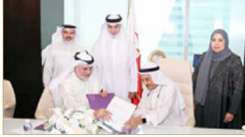
الشيخ محمد بن عبدالله يشهد توقيع اتفاقية شراكة بين جمعية السكري البحرينية و "كاف الإنسانية"

رئيس مجلس الوزراء صاحب السمو الملكي الأمير سلمان بن حمد آل خليفة. عن سعادته بهذه الاتفاقية، وقدم الشكر للفريق طبيب الشيخ محمد بن عبدالله آل خليفة وجمعية السكري البحرينية على حسن تعاونهم، مشيراً إلى أن التعاون بين كاف الإنسانية وجمعية السكري لم يكن الأول، حيث قامت "كاف" بتوزيع مضخات الأنسولين على عدد من مرضى السكري في إطار نهج التكافل الاجتماعي الذي تتميز به المملكة.