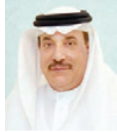
○ وزير العمل.

قانون العمل في القطاع الأهلي الصادر بالقانون رقم (٣٦) لسنة ٢٠١٢، والتي تنص على أنه يعاقب كل من يخالف أيًا من أحكام الباب (١٥) بخلاف أحكام هذا القرار بالعقوبات المنصوص عليها في المادة (١٩٢) من قانون العمل في القطاع الأهلي الصادر بالقانون رقم (٣٦) لسنة ٢٠١٢، والتي تنص على أنه يعاقب كل من يخالف أيًا من أحكام الباب (١٥) والقرارات الصادرة تنفيذاً له بالحبس مدة لا تزيد على ثلاثة أشهر وبالغرامة التي لا تقل عن ٥٠٠ دينار، ولا تزيد عن ألف دينار أو بإحدى هاتين العقوبتين.