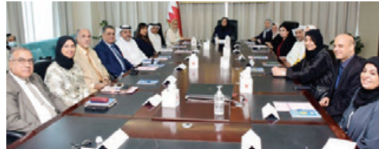
جميع الأعضاء وعدد من المسؤولين بالوزارة، حيث تم استعراض القرار

وفي مستهل أعمال الاجتماع رحبت وزيرة الصحة بكل الأعضاء، وقدمت شكرها إلى اللجنة الوطنية لمكافحة الأمراض المزمنة (غير السارية) على جهودهم المثمرة والتميز خلال الفترة الماضية التي أسهمت في تحقيق العديد من المنجزات والمبادرات، مؤكداً حرصها على مواصلة البناء على تلك الجهود بما يساهم في تحقيق الأهداف المأمولة.